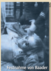
Festnahme von Baader

Die im Hochsicherheitstrakt des Gefängnisses Stuttgart-Stammheim inhaftierten Gefangenen halten jedoch weiterhin geheimen Kontakt zum RAF-Führungskreis.