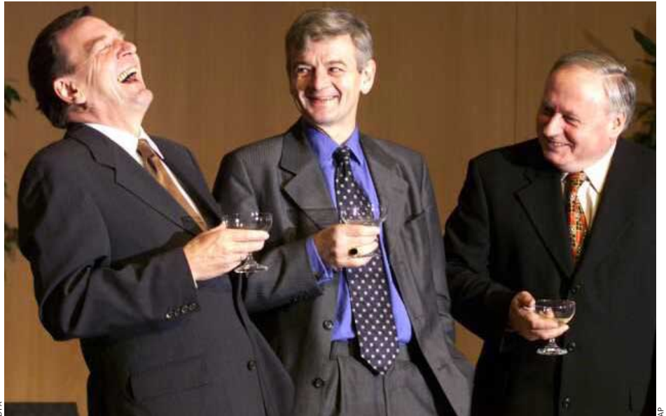
Fischer bei der Vereidigung als hessischer Umweltminister 1985, mit Koalitionspartnern 1998*: Immer nur zum Teil Rebell

und hatte zu den Bedächtigen gehört, die gegen „Mollis“ argumentierten. Nach Erscheinen des Buchs wurde er in einer Frankfurter Kneipe von einem alten Kämpen aus dem RK-Umfeld mit „Na, du Judas“ begrüßt. Seine Antwort: „Habe ich deinen Heiland verraten?“