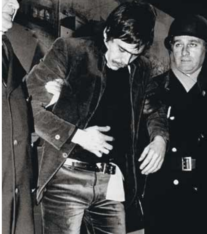
Angeschossener Klein*: Anfang der siebziger Jahre ...