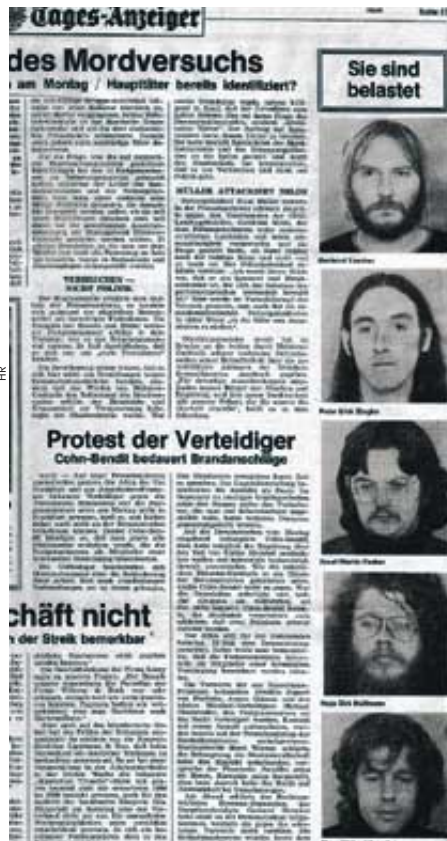
Angebliche „Terroristen“* „Dann sei's drum“

Bis heute ist kein Täter gefunden. Viele Jahre verstaubte die Ermittlungsakte im Staatsarchiv. Nun liegt sie wieder auf dem Schreibtisch eines Frankfurter Staatsanwalts. „Neue Erkenntnisse“, heißt es. Welche das sein sollen, behält die Staatsanwaltschaft für sich. Um Fischer, so viel ist bekannt, geht es dabei nicht. Es geht nicht nur um die Frage, ob Fischer selbst unter