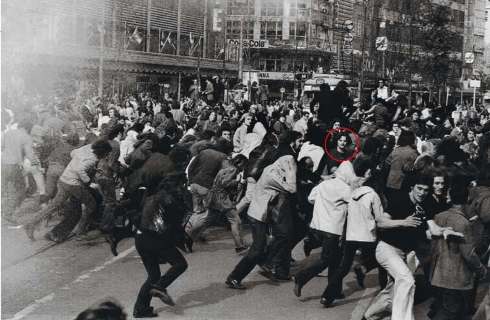
Fischer (Kreis) bei Protest gegen Fahrpreiserhöhungen der Frankfurter Verkehrsbetriebe (1974): Damals die Attacke gelernt