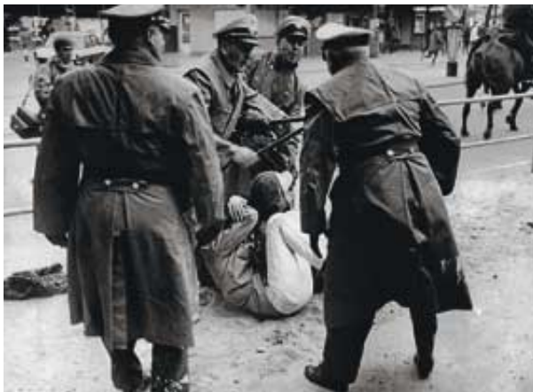
Demonstrant Fischer*: Begegnung mit der Staatsmacht

Kraushaar verknüpft die Aktion mit der Räumung des Schumann-Blocks im Vorjahr. Damals habe „der Nimbus des RK, linksradikal und erfolgreich zu sein, einen empfindlichen Knacks“ bekommen. Eine „militante Eskalationsstrategie“, die nicht nur Aufmerksamkeit garantiere, sondern auch „den inneren Zusammenhalt der Aktivisten erheblich stärke“, sei der Versuch