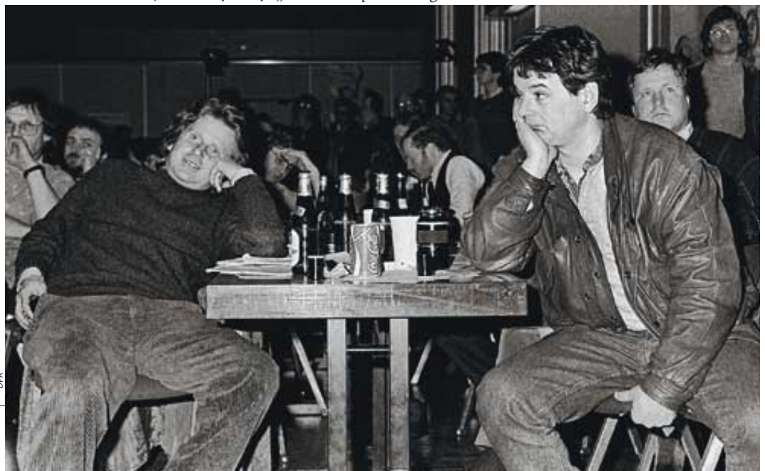
Freunde Cohn-Bendit, Fischer (1987): „Wer behauptet was genau?“

Als sich der Soziologe Oskar Negt im Juni 1972 nach einer Serie von Bombenanschlägen der RAF mit klaren Worten in der Universität Frankfurt von der damals so genannten „Baader-Meinhof-Gruppe“ distanzierte, war es Fischer, der ihm lautstark widersprach. Negt habe mit seiner Rede einen Prozess der Entsolidarisierung eingeleitet, der sich für die gesamte radikale Linke rächen müsse.