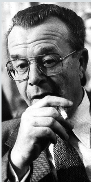
FDP-Politiker Karry (1978) „Buddys“ Erinnerungen