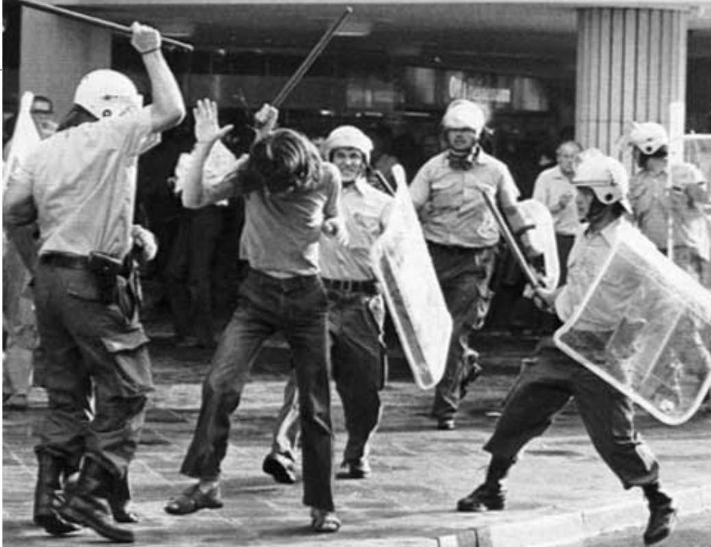
Prügelnde Polizisten in Frankfurt (1976): Rituale der Männlichkeit

In seinem nach dem Ausstieg aus dem Terrorismus veröffentlichten Buch „Rückkehr in die Menschlichkeit“ geht er detailliert auf den Fall ein: Die zwei Waffen seien während der Unruhen „in einem der großen Blumentöpfe zwischen Uni-Hauptgebäude und Juridicum“ zwischengelagert worden. „Keiner der Enteigner war so ver-